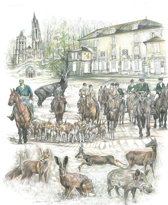
Jean Lamy, Sans titre , crayon sur papier, 2024 © J. Lamy