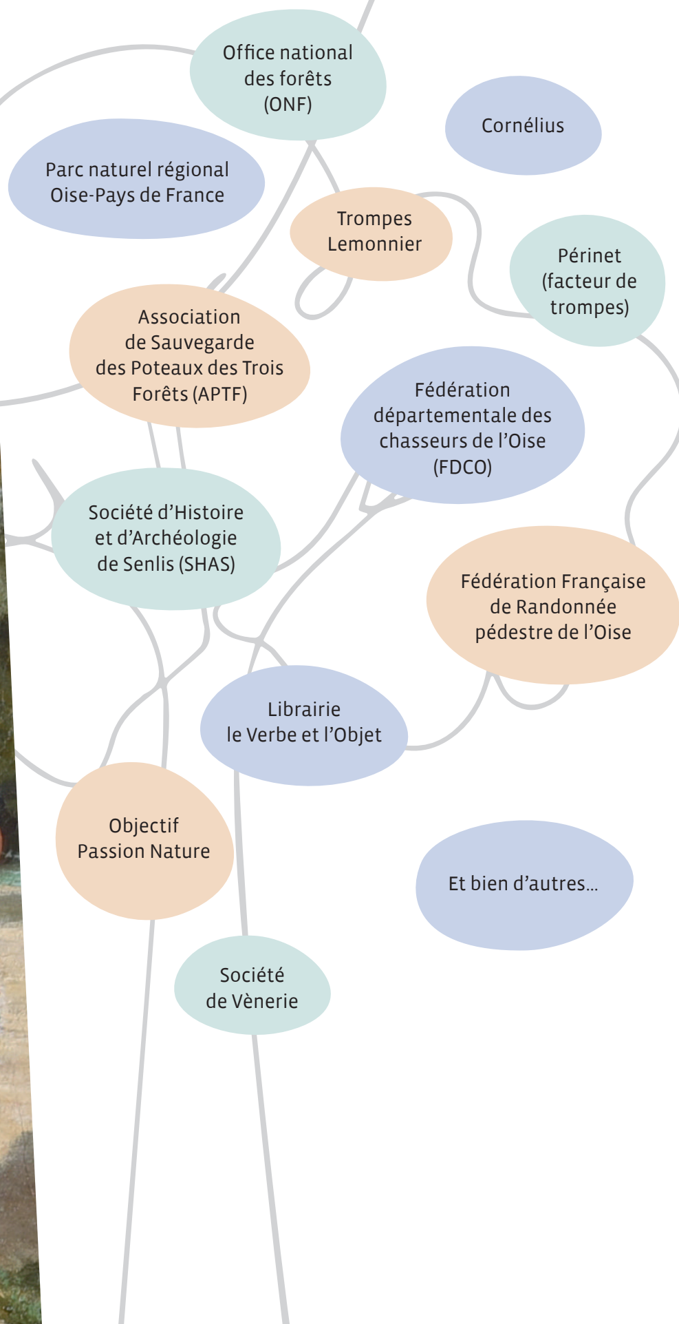
H. Brunelli (?), Rendez-vous de chasse de l'équipage de Wagram en forêt de Fontainebleau , huile sur toile, 2 e moitié du XIX e s.

Ils seront présents, venez à leur rencontre et découvrez leurs actions