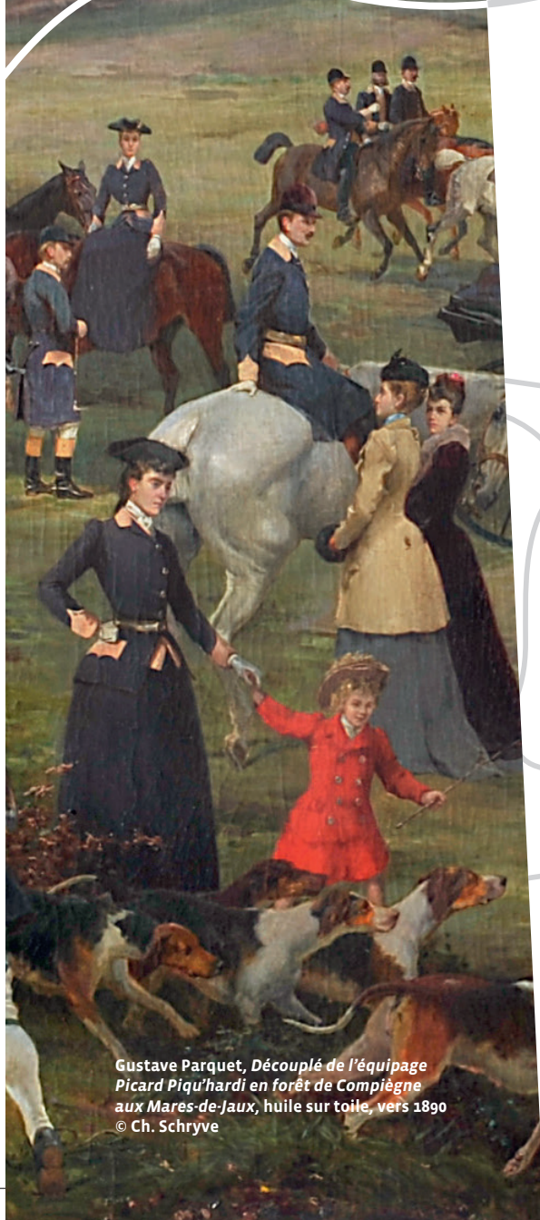
Gustave Parquet, Découplé de l'équipage Picard Piqu'hardi en forêt de Compiègne aux Mares-de-Jaux , huile sur toile, vers 1890