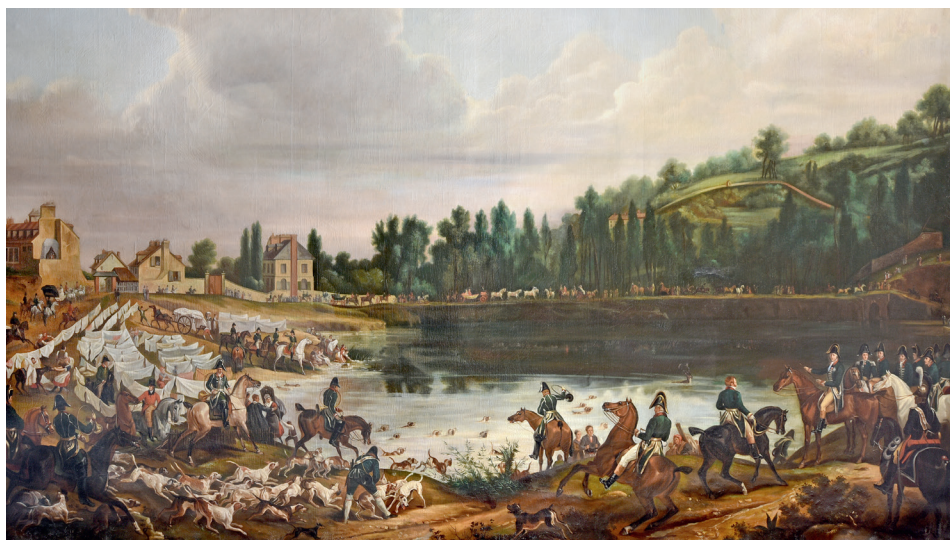
Carle Vernet (d'après), Chasse au daim pour la Saint-Hubert, en 1818, dans les bois de Meudon , huile sur toile, 1 ère moitié du XIX e s.